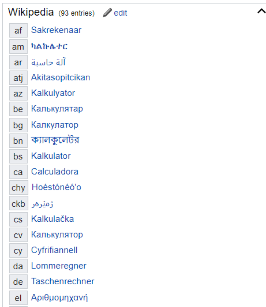
Εικόνα 1. Τμήμα καταχώρισης «calculator» από Wikidata

Τα δεδομένα που υπάρχουν στο wikidata μπορούν να εξαχθούν με τη μορφή ενός αρχείου xml με μέγεθος γύρω στα 50 GB ή εναλλακτικά σε μορφή JSON ή RDF 2 . Η μορφή αποθήκευσης των χαρακτήρων σε μη λατινογενείς γλώσσες ενδέχεται να είναι σε ακολουθίες διαφυγής Unicode (Unicode escape sequences) 2 : βλέπε για παράδειγμα παρακάτω το ελληνικό τμήμα της καταχώρισης New York (μετά το «title») σε μορφή RDF.